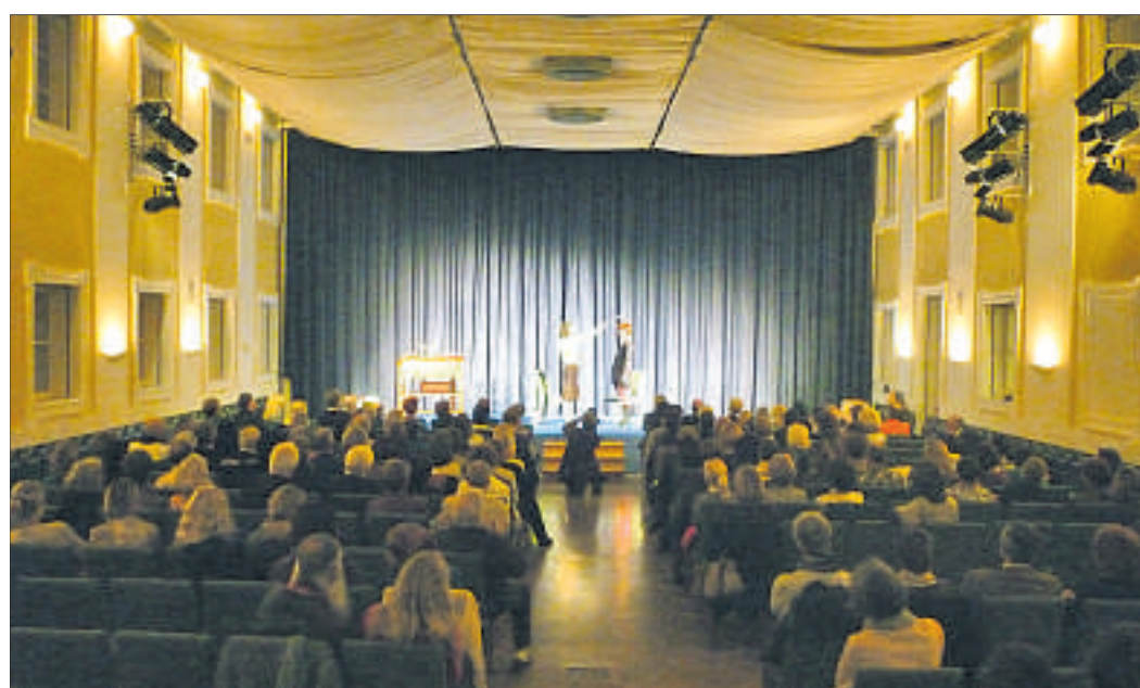
Blick in den gut besetzten Saal im Salzburger Gwandhaus während der Demonstration.

die jahrhundertalte wenn gleich selten gewordene Tradition mit beiden Anliegen ein: Kommerzielle Zwecke werden hier ebenso verfolgt wie kulturelle Anliegen. Unter dem Gwandhausdach in eigenständiger alpenländischer Ausprägung begegnen sich also auch heute – ähnlich wie damals – Kunden, Besucher, Mitarbeiter und Gäste zum Essen, zum Er-